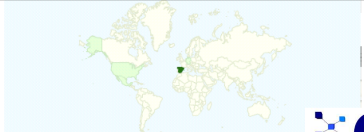
Gráfico de visitas por ubicación